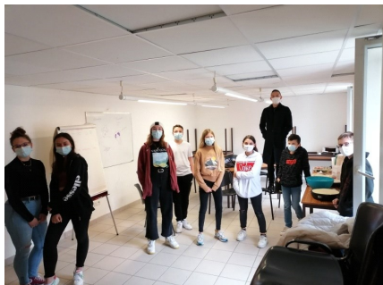
Préparation du séjour lacs du Verdon. Du 12 au 15 mai 2021 (sous réserve...).

Les différents groupes de jeunes de la MJC ont commencé à organiser les séjours de l'été 2021.