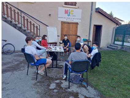
Préparation du séjour « Lycéens ».